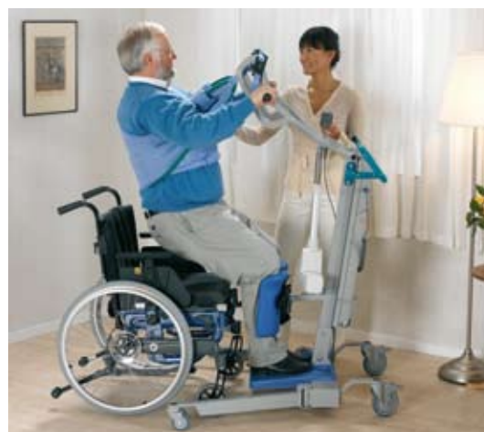
Il trasferimento nella sedia a rotelle viene eseguito in modo agevole e perfettamente controllato.