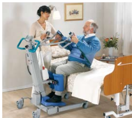
SARA 3000 permette ad un solo assistente di portare l'assistito in posizione eretta in assoluta comodità e sicurezza.

SARA 3000 semplifica il lavoro degli assistenti perché consente ad un solo operatore di trasferire gli assistiti in tutta sicurezza, eliminando completamente il ricorso al sollevamento manuale. L'ausilio solleva l'assistito portandolo in posizione eretta e sorreggendone il tronco in modo ottimale. Il design ergonomico dell'ausilio consente di azionare e controllare SARA 3000 in modo semplice e pratico mediante il comando a distanza o la doppia pulsantiera posta sull'attuatore. I doppi comandi aumentano l'efficienza e la sicurezza dei trasferimenti e consentono all'assistente di dedicare maggiore attenzione all'assistito, incoraggiandolo a partecipare attivamente alla routine di trasferimento.