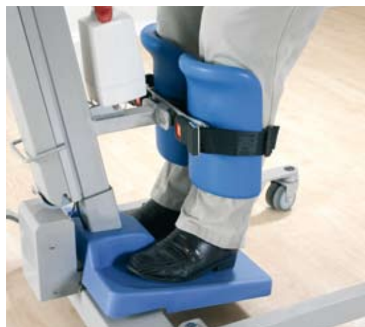
Il poggiapiedi ottimizza la stabilità e la sicurezza, mentre la ginocchiera consente la naturale flessione della caviglia.